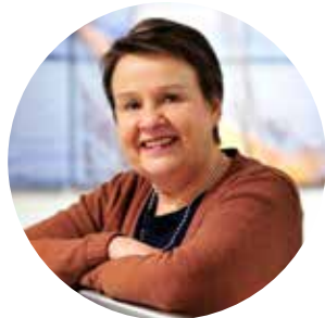
KIRSI VARHILA hyvinvointialuejohtaja Satakunnan hyvinvointialue