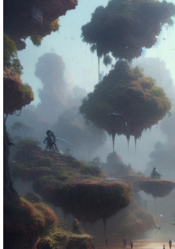
Tämä kuva on tekoälyn luoma.

”Samalla on mietittävä entistä tarkemmin, minne dataa säilötään ja kenellä on siihen pääsy.”