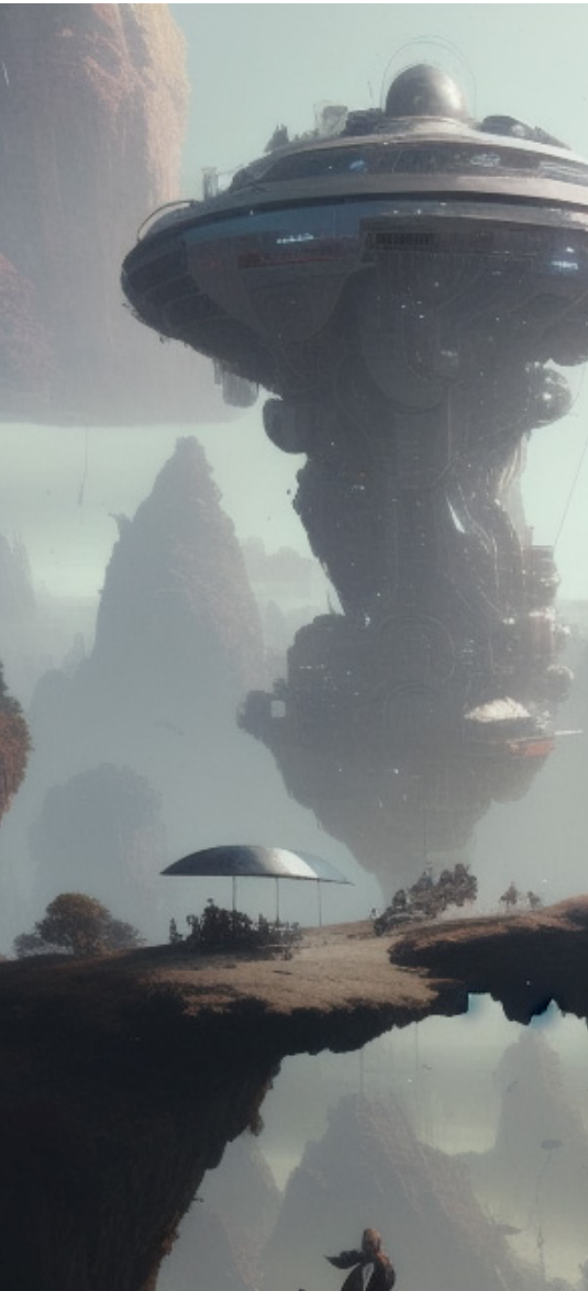
Tämä kuva on tekoälyn luoma.